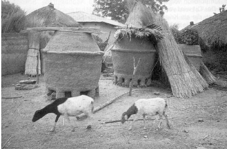
Speicher im Norden von Togo (Wodtcke 1998, S. 621)

Entgegen immer wieder aufgestellten Behauptungen, "die fröhlich in den Tag hineinlebenden Neger" würden keine Vorratslagerung betreiben, kennen viele schwarzafrikanischen Völker, vor allem in den Savannengebieten, die Vorratslagerung seit vielen Jahrhunderten, und die von ihnen genutzten Kornspeicher prägen das Bild eines Dorfes wesentlich mit.